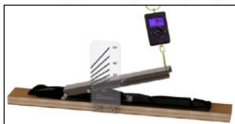
Mesures d'efforts mécaniques